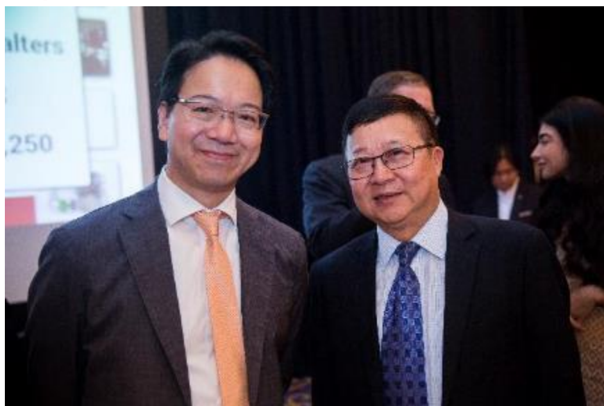
左起：代表資訊科技界的立法會議員莫乃光與平等機會委員會主席陳章明教授攝於基金會晚宴。