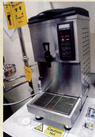
● 當日課室內設有超聲波機，可運用超聲波技術改善奶茶苦澀味道。