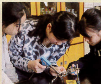
● 工作坊之一是派發LED裝置，讓女同學們學習焊接，並將Coding與工程結合。