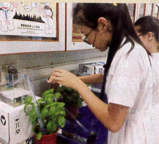
● 於植物上加入電子裝置，以科學方式種植，是STEM的生活例子，也是今屆的工作坊活動之一。