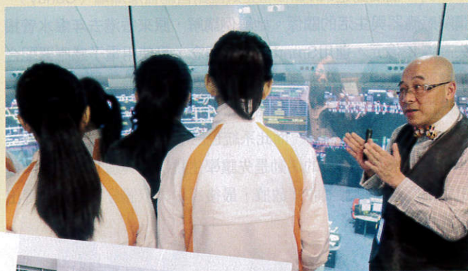
● Girls Go Tech全年計劃之一的項目有參觀企業，從中理解科學應用在生活範疇，圖中是地鐵最大的控制中心，負責人向同學講解列車路線的情況。

Girls Go Tech培育女學生外，也期望能用種籽概念，從鼓勵學生開始，進而影響全校氣氛，甚至影響其他學校。筆者期望她們明年更上一層樓，讓更多香港女生有科技觀。