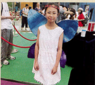
● 婦女基金會曾作多項研究，發現不少女孩誤以為科技很男性，但參與Girls Go Tech後，女生也學會將科技融合生活，圖中是女學生自行設計LED服飾。